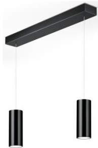
HELLI Pendant lamp 51.506.xx 4 x 8 W LED, 2.700 K, 4.280 lm, EEL-E